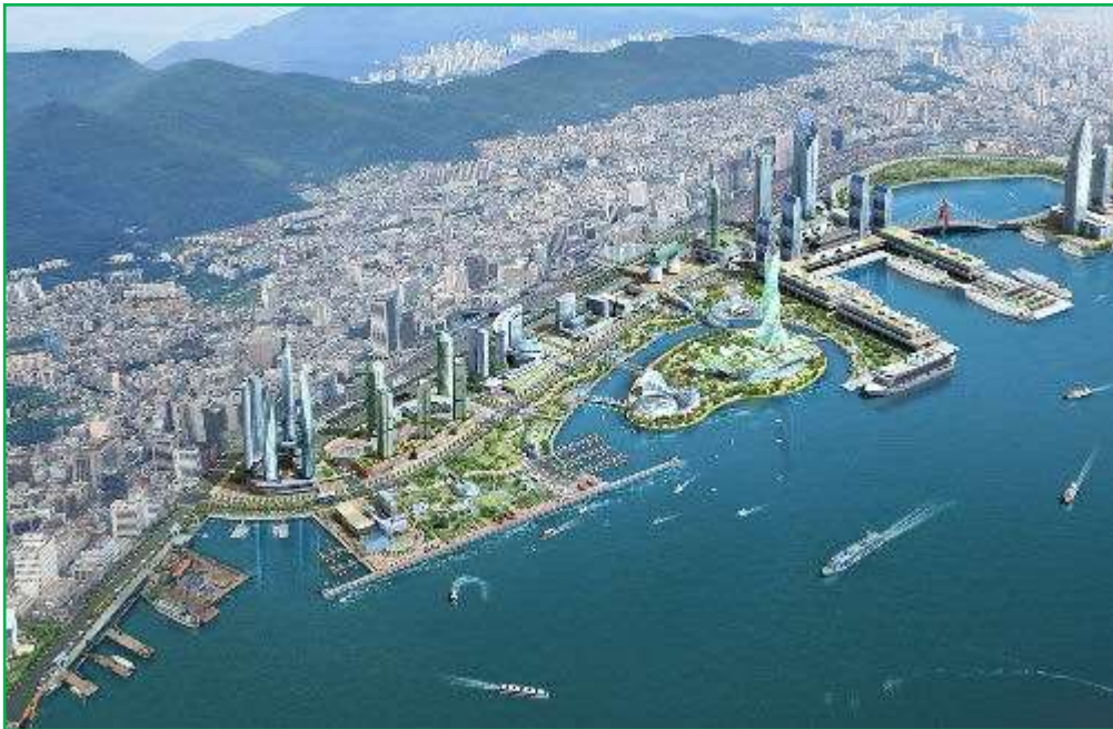
Veduta di Busan - Corea

C'è la fiducia nella Parola di Dio, al di là del clericalismo. La Parola di Dio ha una forza potente. I cattolici, in Corea, sono l'8%, ma questa piccola realtà ci meraviglia, sebbene con modalità diverse dalle nostre. In chiesa gli uomini sono a destra e le donne a sinistra. Nella Cappella dell'Adorazione non ci sono né banchi, né sedie: chi vuole adorare si deve sedere sul pavimento.